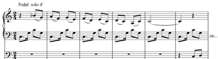
Ex. 3: Três Pequenas Peças sobre Asa Branca , de Eugênio Gall. Uso do ritmo de baião e o modo mixolídio.

Mesmo assim, as análises das obras nesta pesquisa mostram que há uma evolução na música brasileira para órgão em relação ao repertório usual para o instrumento, tanto nas motivações como nos materiais utilizados. Ainda que baseados nos paradigmas organísticos, os compositores-organistas brasileiros têm um vocabulário mais ampliado e com características próprias. Um exemplo é Eugênio Gall, organista carioca que tem suas Três Pequenas Peças sobre Asa Branca baseadas em uma melodia brasileira, empregando na primeira e na última o modo mixolídio e motivos rítmicos referenciais à música nordestina (Ex. 3), além de uma estrutura baseada em repetições, sobreposições motivicas e ausência de modulações, lembrando derivações da música minimalista e certamente reportando-se às improvisações dos músicos populares nordestinos.