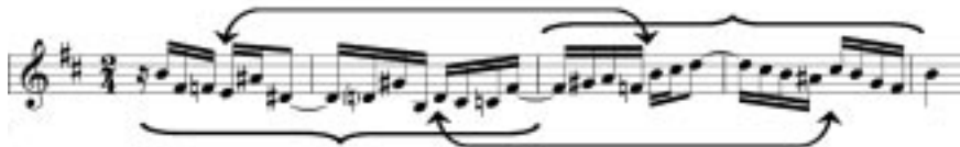
Fig. 4: Simetria no sujeito (c. 1 – 5)

Além da alternância destes dois padrões, pode-se verificar que, agrupados, estes padrões compõem um membro que é repetido na apresentação de S (indicado pelas chaves).