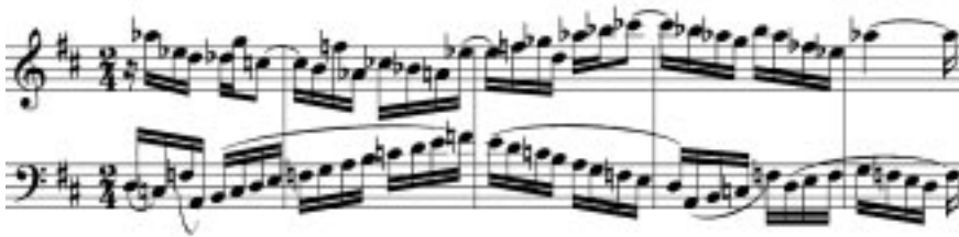
Fig. 3: Segunda reexposição, c. 40 – 44

O segundo evento é a presença simultânea do S na altura original (voz superior) e de um segundo movimento escalar, agora em Si Menor (voz inferior, c. 58 – 62), no final da última reexposição. O único aspecto não determinado é se o 7º grau da escala é maior ou menor: a escala é antecipada pela sensível (7ª maior), mas na sua conclusão, bem como no decorrer de sua apresentação, é sempre utilizada a 7ª menor. Esta abordagem confirma as características da produção pianística inicial de Kiefer, tipificadas por um ambiente de exploração e expansão das possibilidades harmônicas.