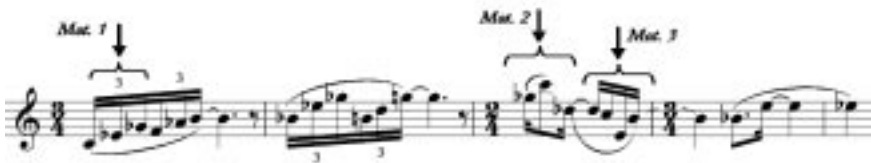
Fig. 6: Sujeito completo , c. 1 – 5

baseado em figurações arpejadas, dispostas numa progressão de tríades diminuta, menor e maior. Seguem duas figurações que utilizam saltos de 4 a , 5 a , 6 a e 7 a . A estrutura rítmica está baseada em três motivos principais (indicados pelas setas, Mot. 1 , Mot. 2 e Mot. 3 , respectivamente). R ocorre na voz inferior, com imitação à 5 a acima (Sol, c. 5).