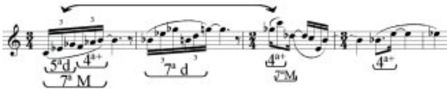
Fig. 8: Sujeito completo (c. 1 – 5), intervalos recorrentes identificados.

aguda de S (indicada pelas setas), coincidindo com a inversão do intervalo composto pela primeira tercina.