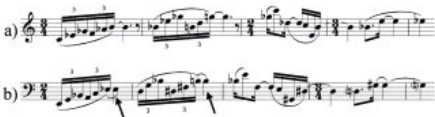
Fig. 10: Sujeito original (10a, c. 1 – 5) e sujeito alterado (10b, c. 25 – 29)

Apesar da instabilidade rítmica do material temático, proporcionada pela sua assimetria, a figuração se mantém constante e regular no decorrer do movimento. Portanto, estas mudanças de fórmula de compasso que ocorrem antes da Toccata não alteram a estrutura do movimento, mas confirmam sua função rítmica em relação ao material temático. As outras três mudanças de fórmula de compasso ocorrem no início e no decorrer da Toccata (c. 57, 65 e 67, respectivamente). Dada a profusão de figurações rítmicas e melódicas nesta seção, estas últimas mudanças de fórmula de compasso não apresentam uma relação significativa com os elementos elaborados, e nem com a estrutura da seção.