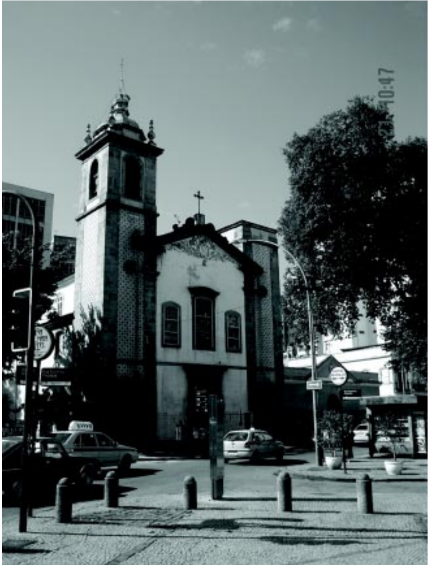
Igreja do Carmo, antiga Igreja da Lapa do Desterro, Rio de Janeiro