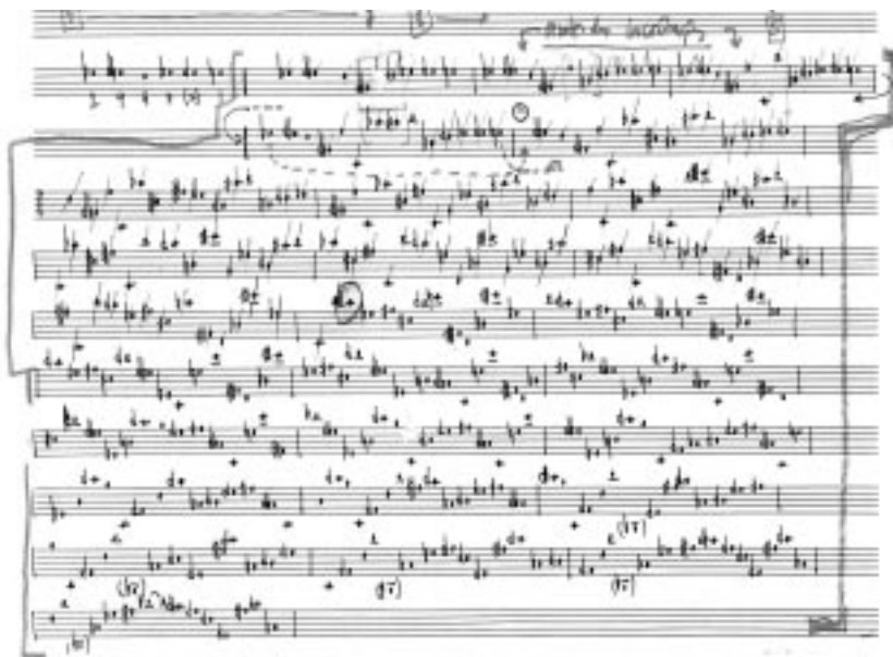
Ex.5 – mescla por incrutação gradual das notas resultantes das permutações no corpo do primeiro gesto.