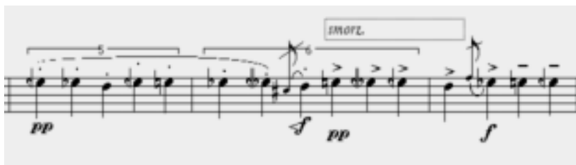
Ex. 3: compassos 3-5 de Ritornelo exemplificando o acelerando (sextina) e o rallentando (unidade normal do compasso).

dades para o mesmo espaço. Esta estrutura temporal é simplesmente retomada para os compassos 3 e 4, seguida da incrustação de um novo compasso, mais lento, de quatro unidades e ao longo de toda a peça tomará nova dimensão, quando passará a ser a permutação de uma série de compassos. Uma idéia totalmente abstrata e estranha ao primeiro gesto, a não ser pela idéia cada vez mais presente de um tempo maleável, não medido associável à irregularidade do aparecimento de objetos, e à regularidade cambaleante da permutação das cinco notas iniciais: