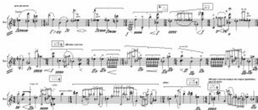
Ex.6 – emprego das notas extraídas do mecanismo de incrutação e crescimento pelo centro do exemplo 6.

Para concluir esta breve apresentação das principais idéias presentes na composição de Ritornelo , valeria aqui complementar algumas que as técnicas empregadas foram tomadas como variáveis de técnicas de permutação (como as permutações simétricas empregadas por Olivier Messiaen), dos filtros de substituição de termos (desenvolvida por Brian Ferneyhough). E mesmo