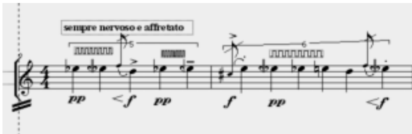
Ex. 2: primeiros dois compassos de Ritornelo , com a seqüência do gesto inicial e as incrustações na forma de appogiaturas (notas circundantes de mi e ré).

O primeiro modo de deformação empregado em Ritornelo é o da permutação, o que aplicado sobre um gesto bastante simples, dá a impressão de simples prolongamento do gesto. Segue um novo modo de deformação: a incrustação. Incrustação de appogiaturas, de mudanças timbrísticas, de grandes blocos. Uma série de inserção irregularmente medidas que fazem de Ritornelo um jogo de espelhamentos, permutações e incrustações.